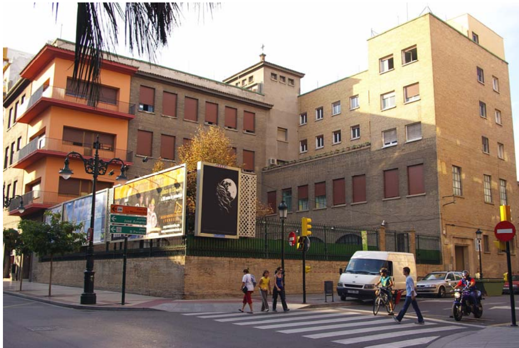
Ntra. Sra. Del Carmen y San José Escuela promotora de la salud